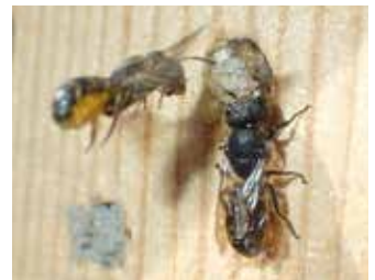
Väggbin vid bohål.