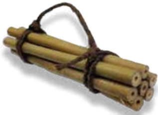
Bamburör – fäst dem så att de inte rör sig.