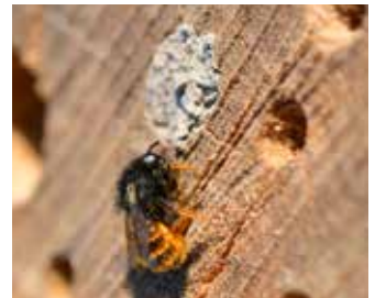
Rödmurarbi vid sitt bo.

Rapportera ditt vildbihotell på www.raddabina.nu