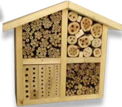
Vildbi-lyxhotell av träbitar och ihåliga växter, fläder, hallon, vass.